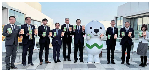
よい仕事おこしフェア実行委員会が和歌山県と長崎県の企業をマッチング

「新しい販売先を増やしたい」というお客さまを対象に、全国の信用金庫とのネットワークを活かしたビジネスマッチングサイト「よい仕事おこしネットワーク」や「しんきんコネクト」を中心とした販路開拓の支援を行っております。また、2021年11月から(株)ココペリが運営する経営支援プラットフォーム「きのくに Big Advance」の取り扱いを開始し、サポートプログラムの充実を図っております。