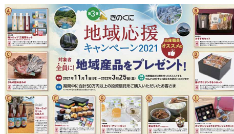
地域産品をプレゼントする 「きのくに“地域応援”キャンペーン2021」を実施