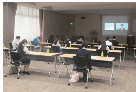
新人・若手社員向け研修会