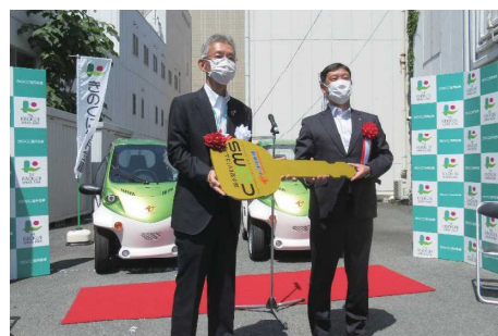
超小型電気自動車「コムス」を導入