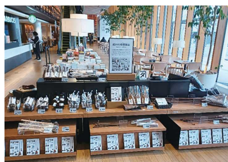
和歌山市民図書館内蔦屋書店で ポップアップストアを開催